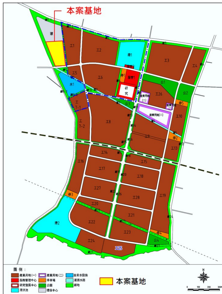
圖 1 本案基地位置示意圖

本案基地位於臺南市柳營科技園區內，營運及興擴建區位為工一路北側之部分環保中心用地(包括污水處理廠及部分環保中心用地)，詳圖 1 所示，總面積約為 4.26 公頃(實際面積依土地登記簿登載為準)。