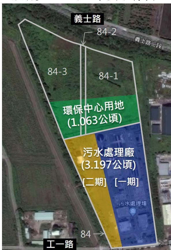
圖 2 本案基地範圍示意圖