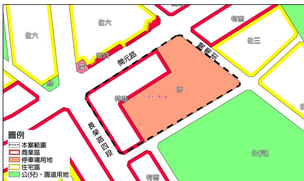
圖 1 本案基地區位及都市計畫示意圖

本基地所在街廓位於開元路以南、長榮路以東、開南路以西及開元公園北側 8 公尺計畫道路以北，總面積為 1.0644 公頃（實際面積依土地登記簿登載為準）。仁愛段 91-7 地號土地使用分區屬商業區，仁愛段 90-2 及 91 地號土地使用分區屬停車場用地（詳圖 1 所示）。